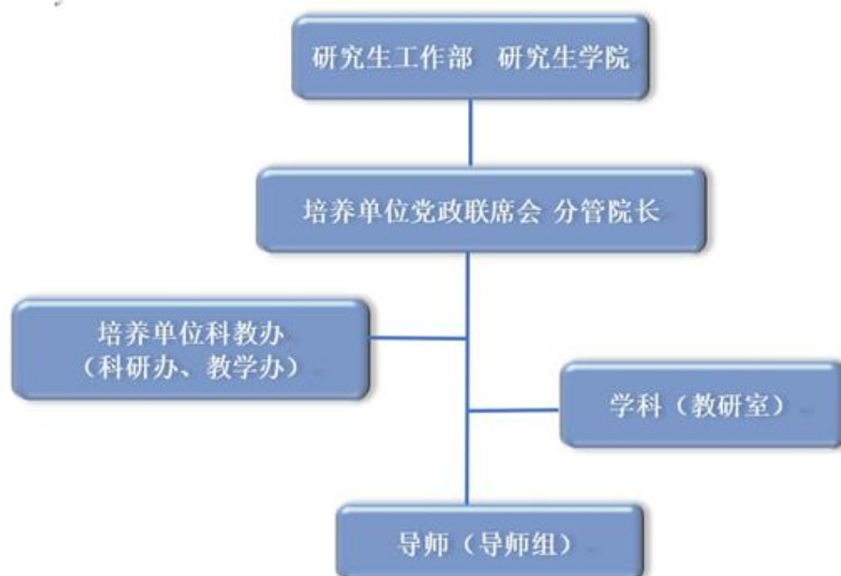
图 2 研究生管理机构模式图